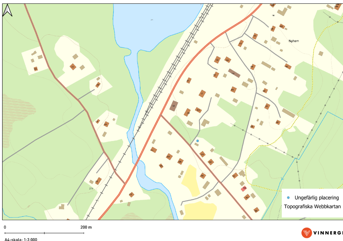
Figur 3 – Ungefärligt område för placering av tornet på den aktuella fastigheten.

Den aktuella placeringen omfattas inte av några motstående intressen. Placeringen skulle medföra att majoriteten av tornet skymms av ett skogsparti för många av de närboende. Eftersom området redan är exploaterat genom den järnväg och väg som löper parallellt med området bedöms tornet påverka landskapsbilden marginellt. Placeringen är lokaliserad på öppen mark, men enstaka träd kan komma att behöva avverkas för åtgärden. Påverkan på naturmiljön bedöms vara försumbar. Det finns inga kända fornlämningar i placeringens närområde.